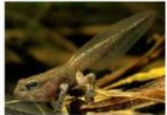
Têtard avec pattes