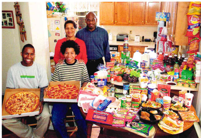
Doc 1 Ce que mange une famille américaine en une semaine Peter Menzel, Planète affamée : ce que mange le monde , 2007

Cette tendance entraîne un problème de santé publique important : deux Américains sur trois sont en surpoids. Face à ce problème, les Américains essaient de modifier leurs habitudes alimentaires en consommant des produits plus sains.