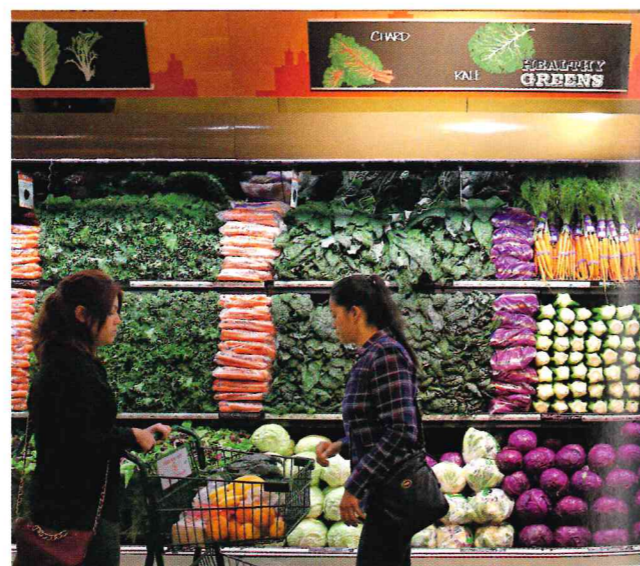
Doc 3 Un supermarché Whole Foods à San Francisco