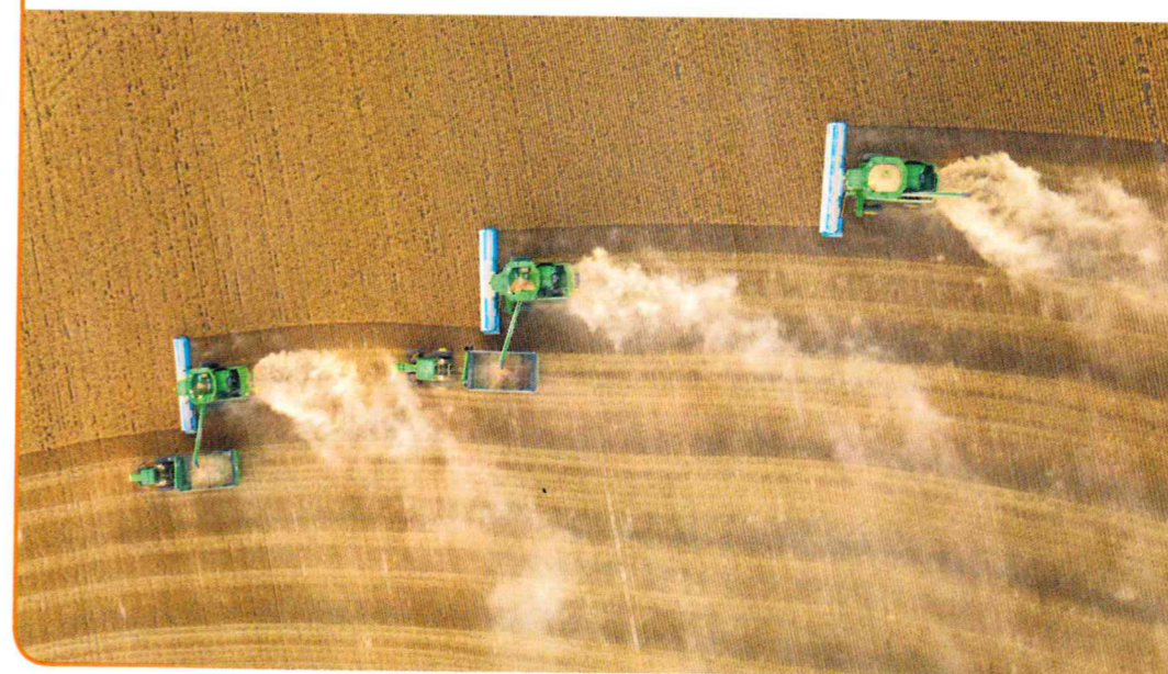
Doc 5 Des champs cultivés à Scott City