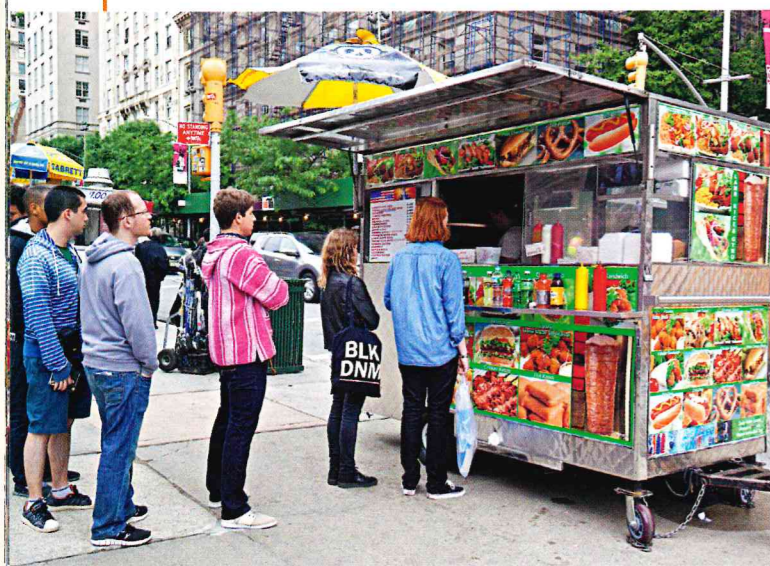
Doc 2 Un stand de restauration rapide à New York

Beaucoup de repas sont aussi pris à l'extérieur du domicile, dans des lieux de restauration rapide (fastfood).