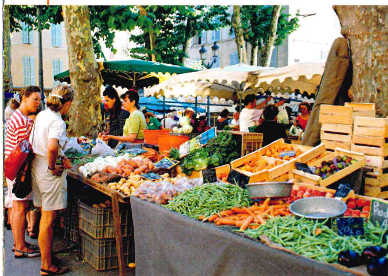
Doc 2 Un marché à Aix-en-Provence (Bouches-du-Rhône)

(boulangerie, boucherie, etc.) et les marchés. De nouveaux modes d'approvisionnement apparaissent, qui privilégient les circuits courts (vente à la ferme, AMAP).