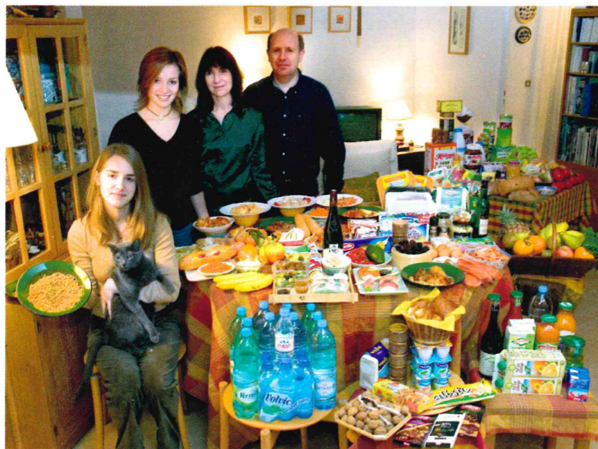
Doc 1 Ce que mange une famille française en une semaine Peter Menzel, Planète affamée: ce que mange le monde , 2007

L'alimentation et le repas familial occupent une place importante dans la culture française. Depuis une cinquantaine d'années, le type de produits consommés change: les Français mangent de plus en plus de produits transformés par l'industrie agroalimentaire au détriment des produits frais (viande, poisson, légumes et fruits).