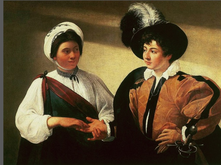
Caravage, Diseuse de bonne aventure, 1594