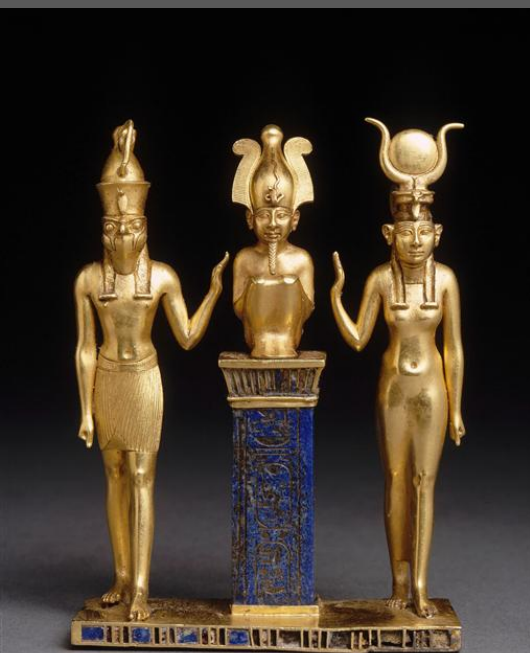
De La Tour, Madeleine, 1643 Pendentif d'Osorkon II, IXème siècle av JC