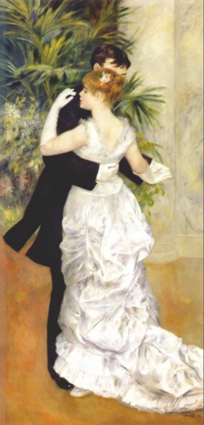
P-A Renoir Danse à la ville, 1883