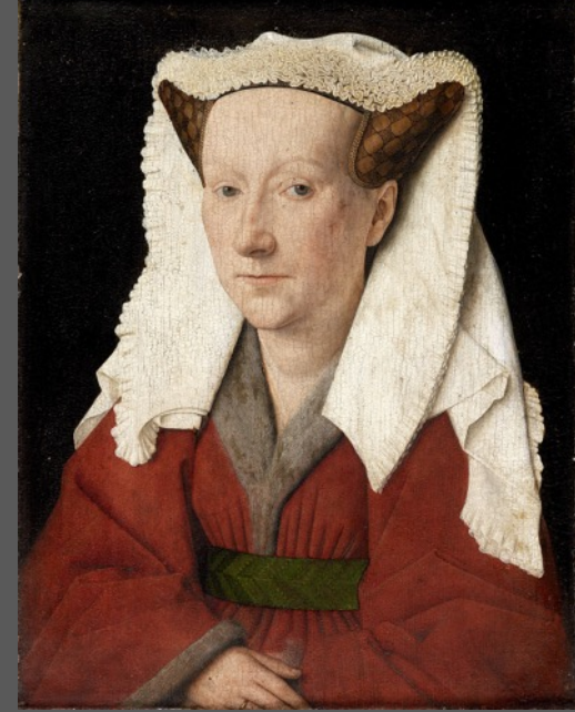
Van Eyck Margareta Van Eyck, 1439