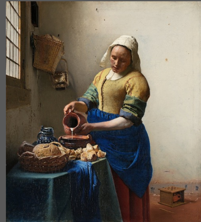
Vermeer La Laitière, 1658