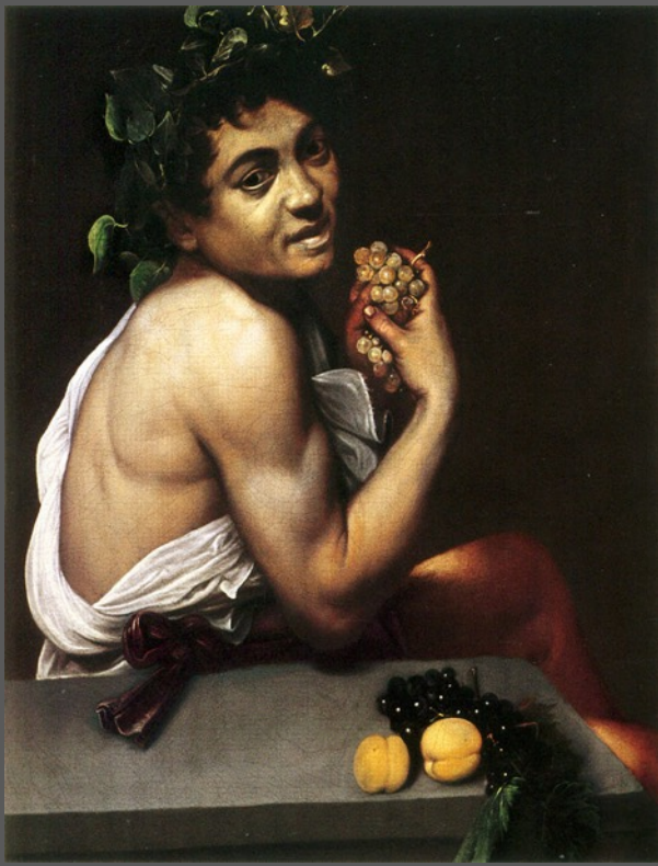
Caravaggio Bacchus malade, 1593