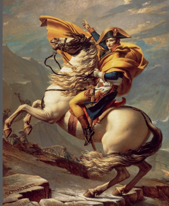
J-L David Bonaparte franchissant le St Bernard , 1801