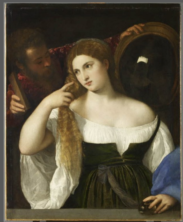
Titien Femme au miroir, 1515