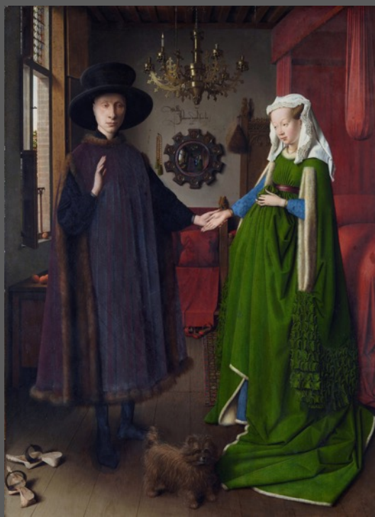
Jan Van Eyck Les époux Arnolfini, 1434