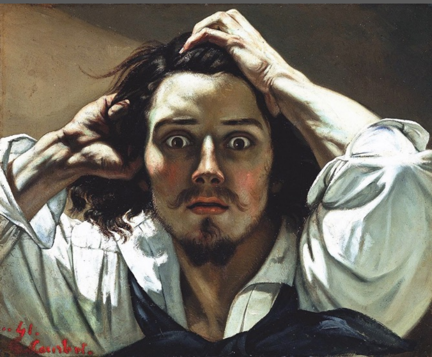
Gustave Courbet Le Désespéré , 1844-1845