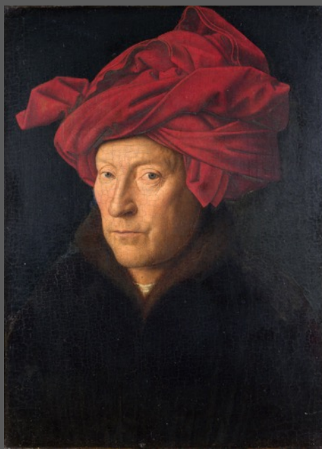
Jan Van Eyck Homme au turban, 1436