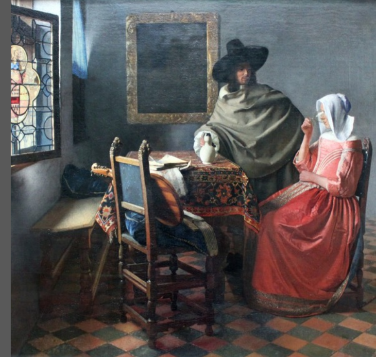
Vermeer, Jeune fille au verre de vin, 1660