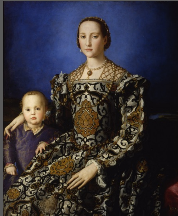
Bronzino Eléonore de Tolède et Giovanni, 1545