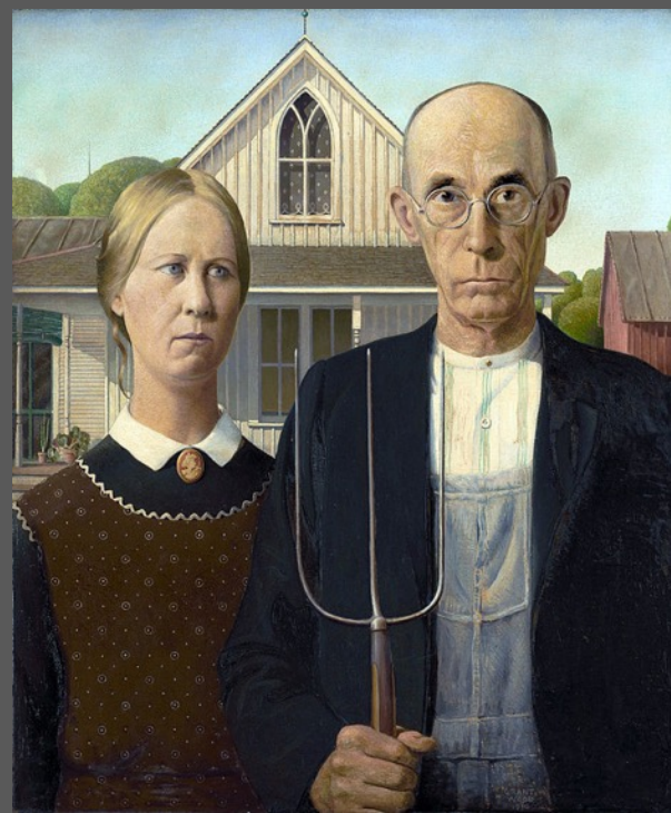
Grant Wood American Gothic, 1930