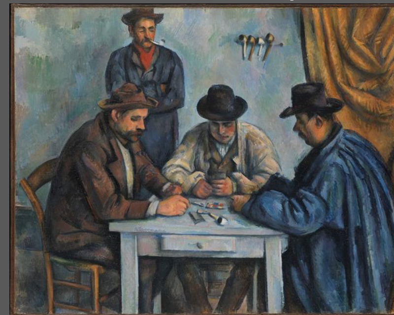
Paul Cézanne Les joueurs de cartes, 1893