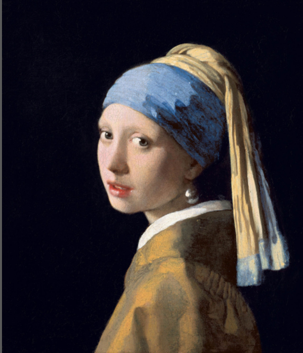
Johannes Vermeer La Jeune Fille à la perle , 1665