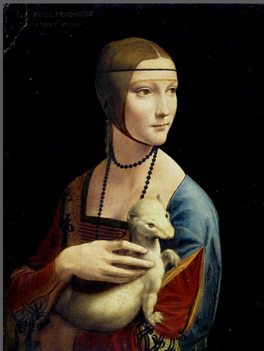
Léonard de Vinci La Dame à l'Hermine , 1489