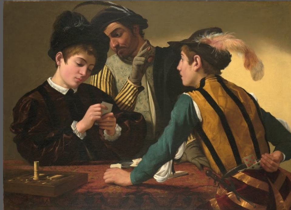
Caravage, Les tricheurs, 1595