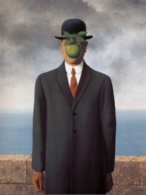
René Magritte Le Fils de l'Homme, 1964