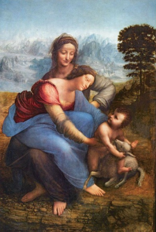
Léonard de Vinci La Vierge, l'Enfant et Ste Anne, 1519