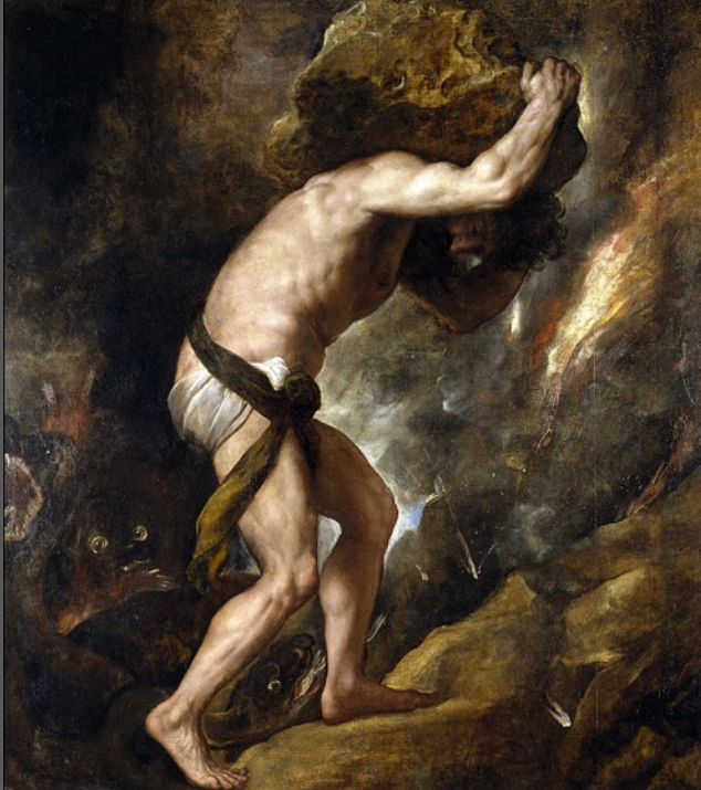
Titien Sisyphes , 1549