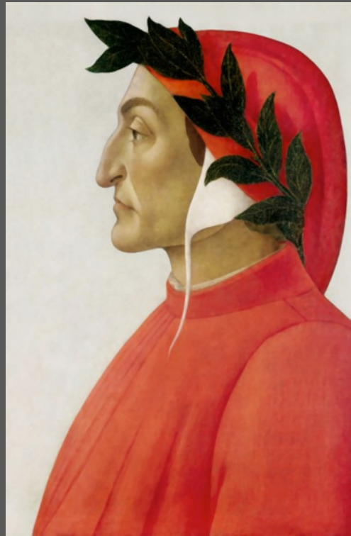
Sandro Botticelli Dante, 1495