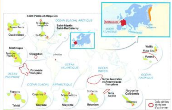
Doc 3 La France en Europe et en outre-mer

aux siècles précédents, la France a colonisé des territoires un peu partout dans le monde. Depuis, certains ont retrouvé leur indépendance alors que d'autres ont été rattachés à la France.