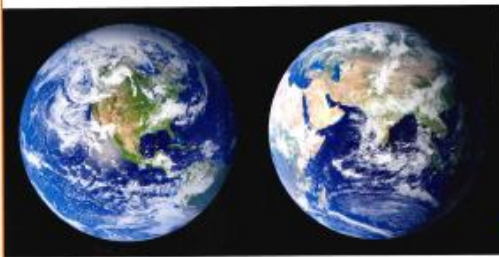
Doc 1 La Terre vue de l'espace

surface des eaux du globe. Si on distingue l'Amérique du Nord et l'Amérique du Sud, on compte sept continents au total. Sans cette distinction, il n'y en a que six. L'Asie est le continent le plus vaste et l'Océanie le plus petit. La France est située en Europe.